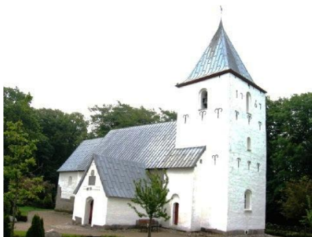
Sct. Knuds kirke