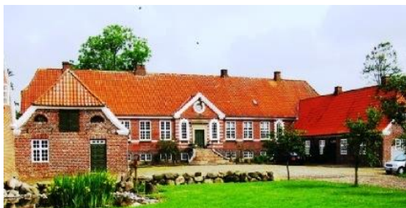
Hovedbygning på Bramming Hovedgård/ Sydvestjyllands Efterskole siden 1984