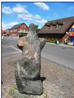
Skulpturen Venus på Vejrup torv