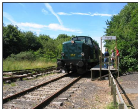
Veterantog ruller ind på Vejrup Station